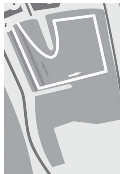
Schwimmen (eine Runde, weisse Linie)