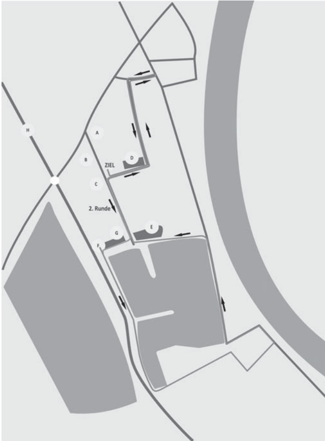
Laufen (zwei Runden)